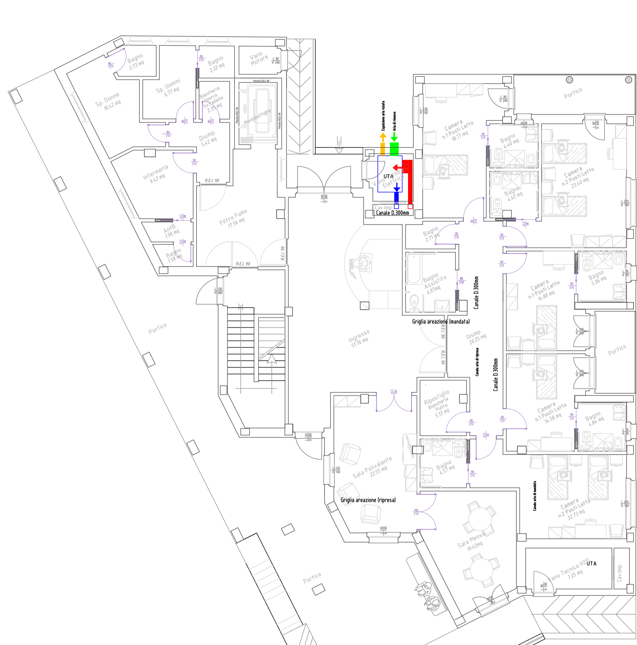
PIANTA PIANO TERRA